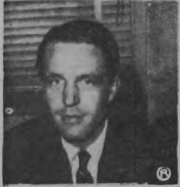
WILLIAM W. WARNES

Ayer fue muy honroso para LA REPUBLICA recibir la visita del señor William W. Warnes, Agregado Cultural a la Embajada de Estados Unidos de América en Costa Rica. El señor Warnes se acaba de hacer cargo de su alta posición y tiene ambiciosos planes de intercambio cultural con nuestro país, los que pondrá en ejecución de inmediato.