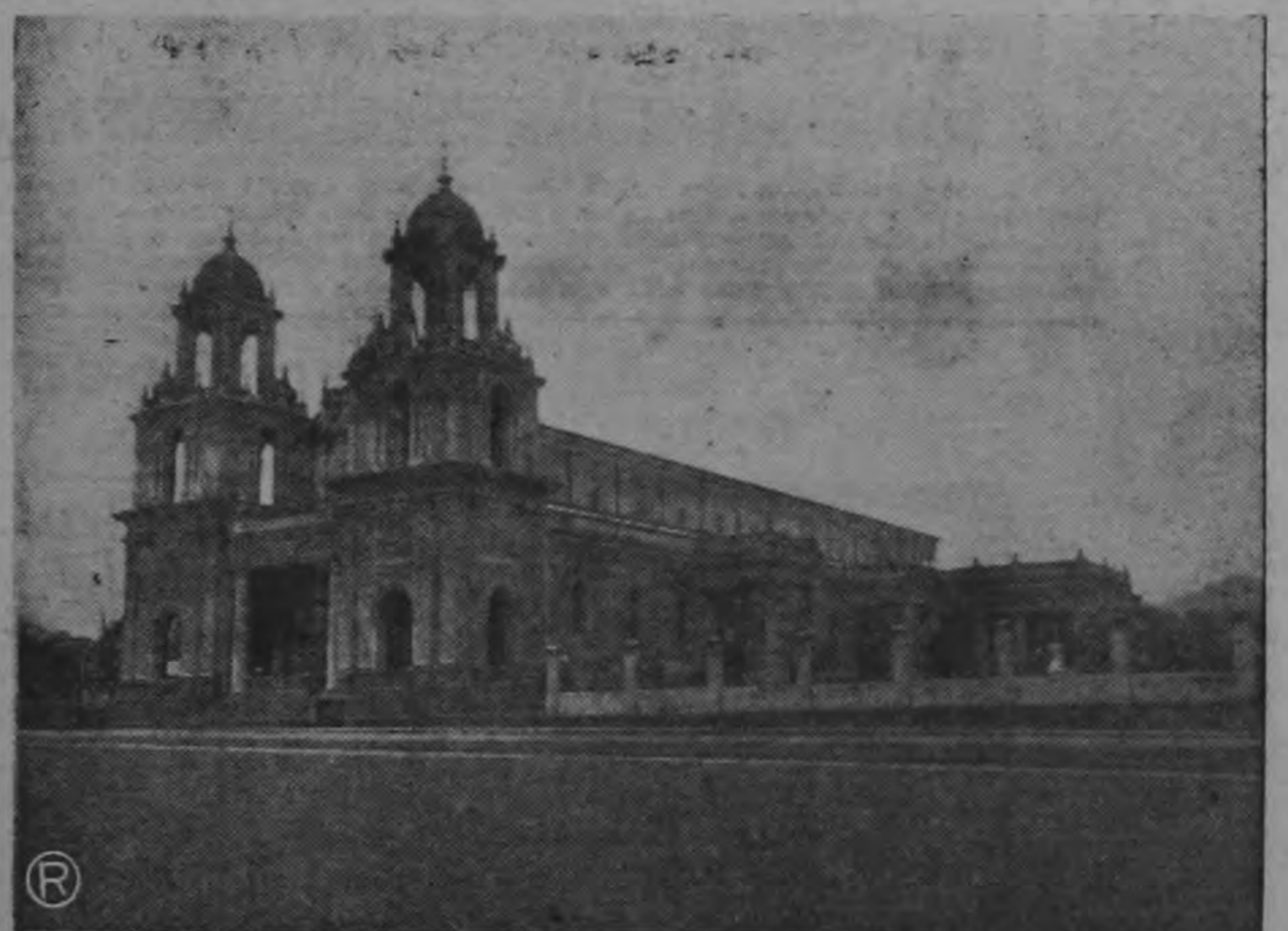
— BASILICA DE SANTO DOMINGO —