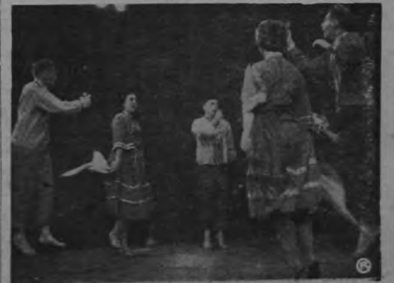
DANZAS ISRAELIS. Aparecen en la foto algunos integrantes de la Embajada Cultural israelí que actualmente visita a Costa Rica en gira de buena voluntad que realizan por América. Ejecutan una de las danzas que enriquecen su folklore israelí, tan lleno de gemas y de creaciones de arte de gran envergadura.