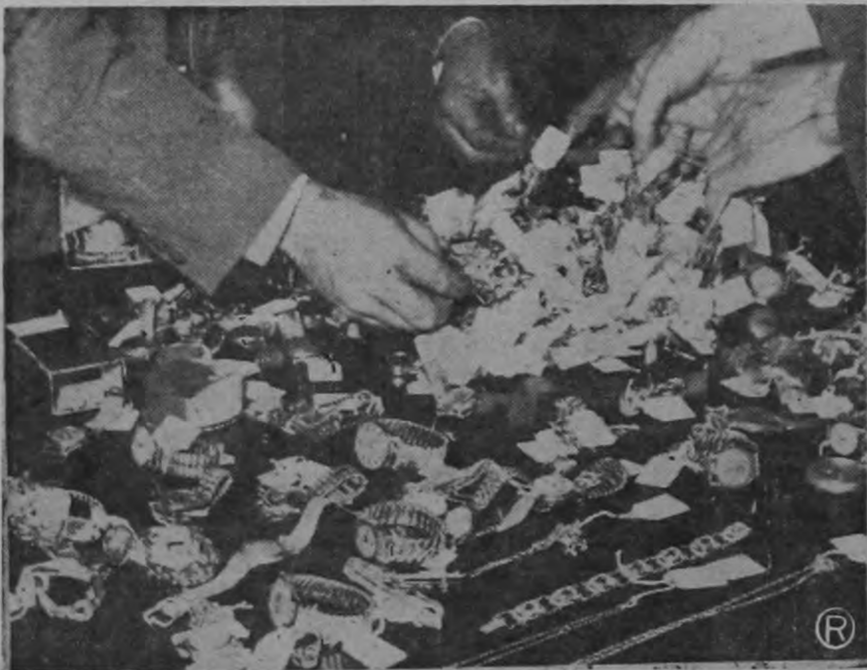
EN CASI 10.000.00 COLONES ha sido calculado el valor de las alhajas de todas clases, que los detectives, tras varios meses de áridas investigaciones lograron decomisar a una cuadrilla de maleantes especializados en esta clase de robos, y al principal sujeto de la trama: el comprador de todo lo robado, a quien los detectives capturaron en "un puerto" del país. Estos detalles permanecen secretos para no estorbar las investigaciones.