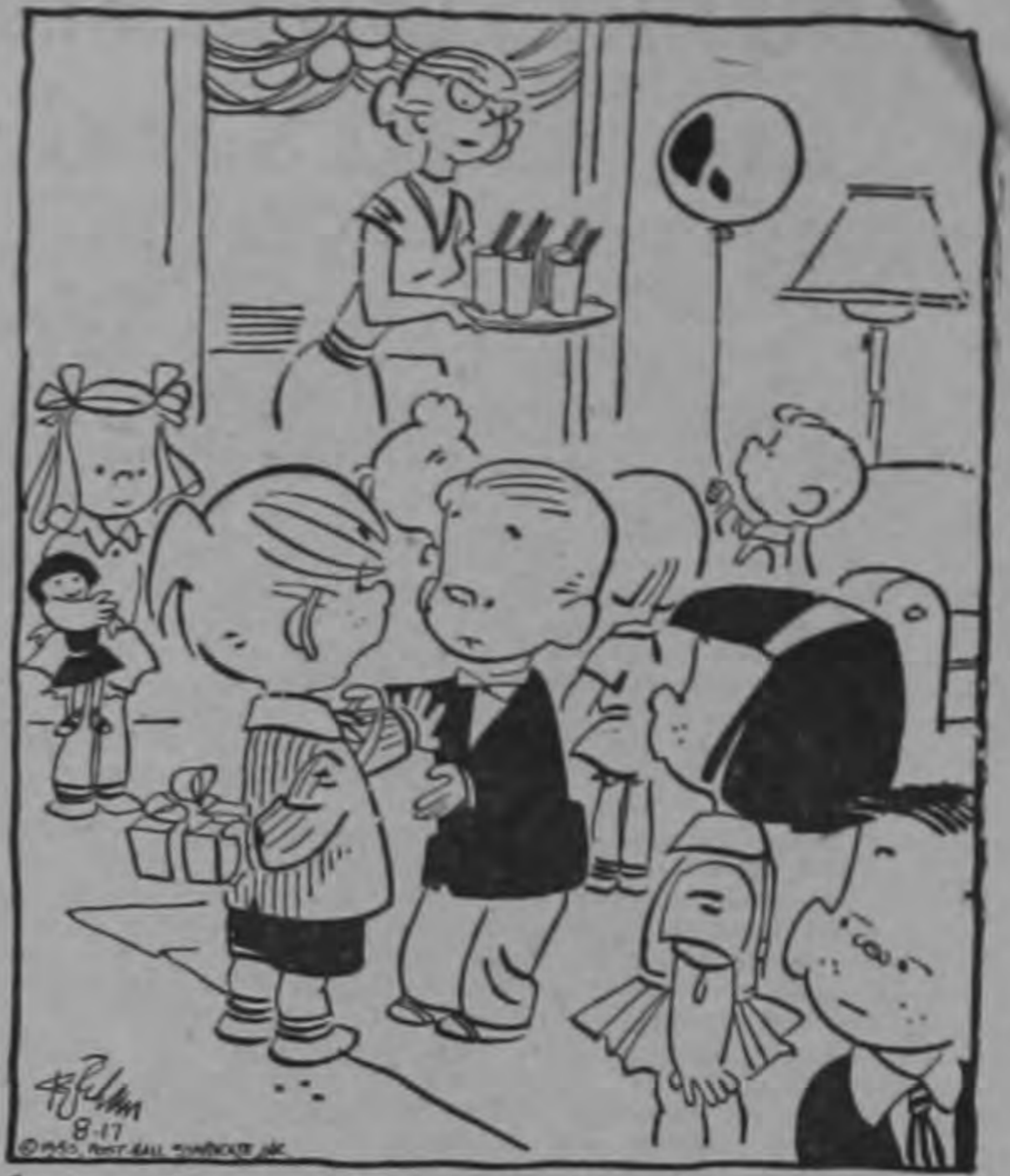
— Si me gustan los dulces Si gano un par de juegos, entonces te daré tu regalo. —

Es fácil deducir de todo lo anterior la ilegalidad de nuestro reglamento de trabajo, pues es lógico que las leyes y reglamentos, deben tener aplicación universal, o sea que para casos iguales ejecuciones, de manera que no debe hacerse uso de ellas a juicio de la persona que las aplique, en el afán de cumplir con el principio democrático de que las leyes regirán, se ejecutarán y se aplicarán en la misma forma para todos los hombres, sin influencias de amistad, familia o conveniencia personal.