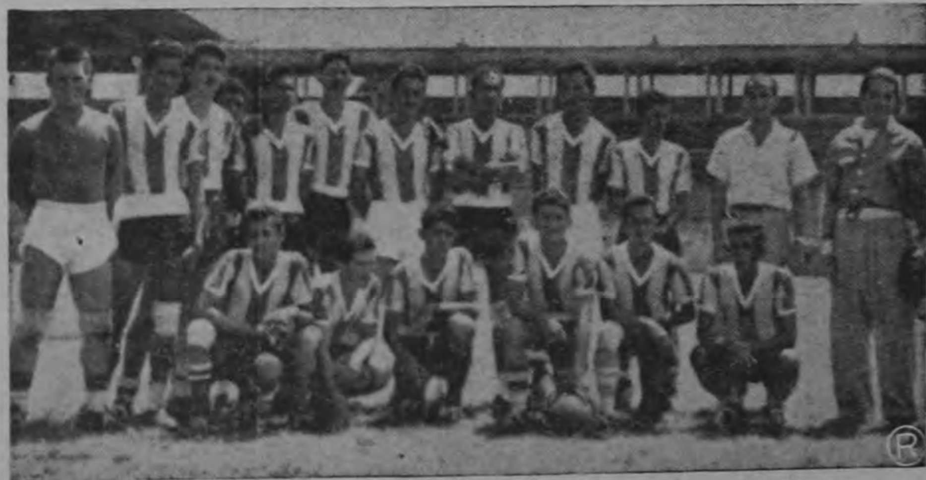
El magnífico equipo guanecesteco ONCE TIGRES de Nicoya posiblemente actúe en esta capital el mes entrante. Sus notables actuaciones frente a equipos de Nicaragua y El Salvador, ha despertado interés de verlos actuar en la capital. Se nos asegura que todo está ya arreglado para que jueguen dos partidos en las siguientes fechas: 15 de Setiembre frente a Nicolás María y 16 de Setiembre frente a Guadalupano, Campeón de Segundas Divisiones. Será una magnífica oportunidad para ahuilatar los progresos innegables que ha conseguido el fútbol pampero, en especial este magnífico cuadro que está calificado como el mejor de toda la provincia guanecesteca.

Es incuestionable que este interesante artículo constituye una excelente propaganda para el turismo de Miami y en general del Estado de Florida hacia nuestro país.