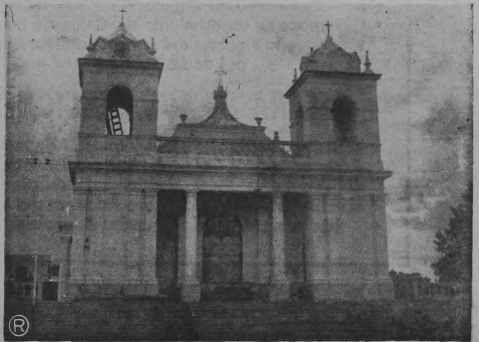
— IGLESIA DEL ROSARIO —

A las 7 a.m. — Misa de Requiem en sufragio de los Párrocos y feligreses que han colaborado durante el siglo en las obras católicas de la Parroquia.